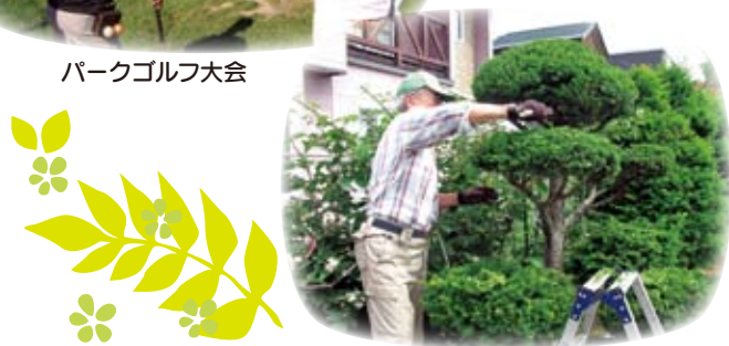
「くらしの助け合いの会」庭木の手入れ