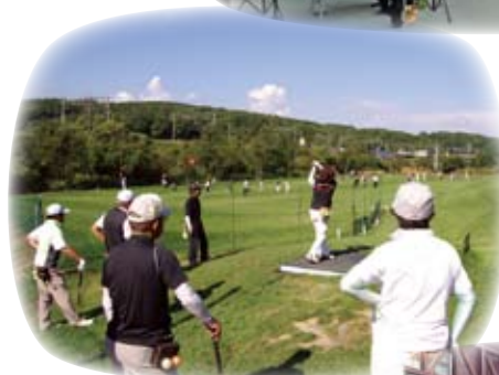
パークゴルフ大会