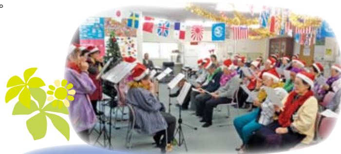
「おげんき会」クリスマス会