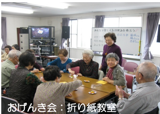
おげんき会：折り紙教室

こんな組合員の声から始まった、医療生協の暮らしの助け合いの会 “りょくあい” の活動は会員の皆様のご理解、ご協力のおかげで今年で18年目を迎えることとなります。