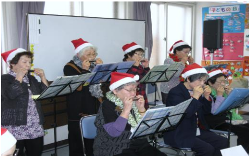
< おげんき会：クリスマス会 >