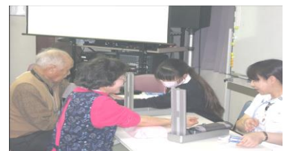
< 始まる前に血圧測定 >