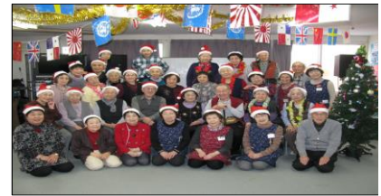
< 季節行事：クリスマス >