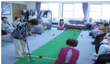
< スカットボール >