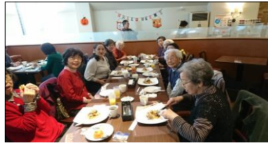
< 外出行事：みんなで外食 >